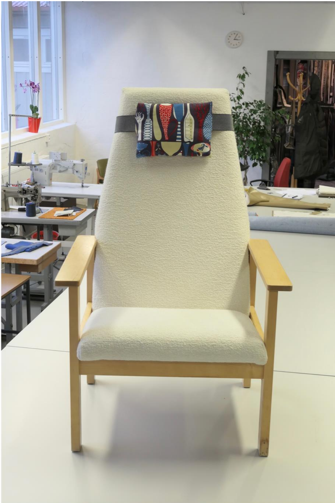
Tada! Omklädd i vit bouclé med nackkudde i tyget Pottery (Stig Lindberg) av tapetserare på Umeå Tapetserarverkstad.