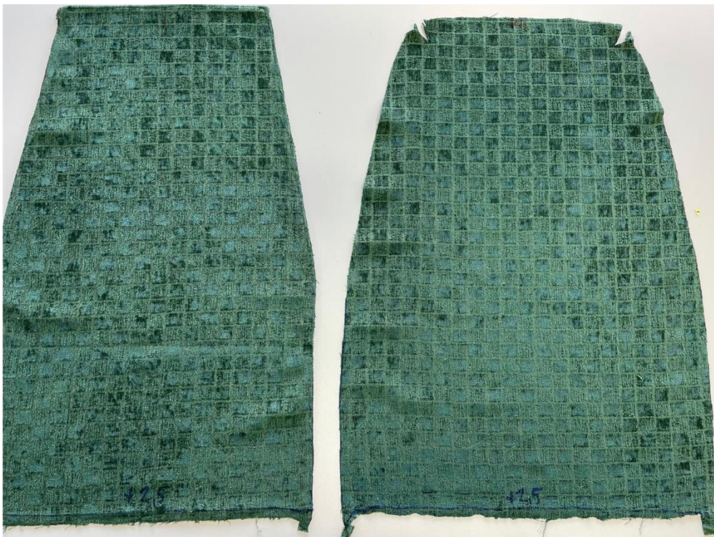
Till vänster bakrygg, till höger framrygg. På framrygg är hörnen uppklippta