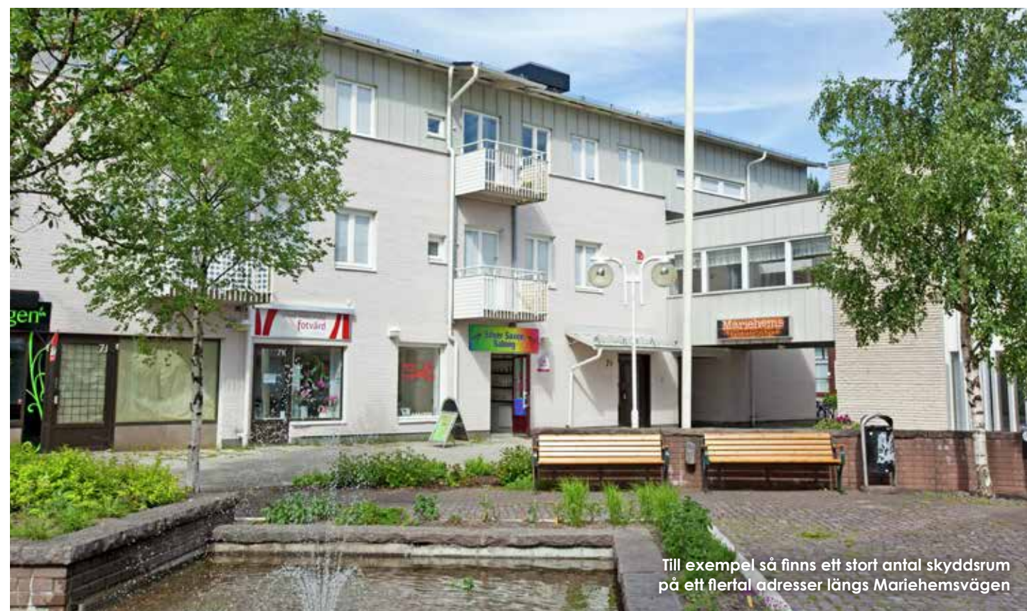
Till exempel så finns ett stort antal skyddsrum på ett flertal adresser längs Mariehemsvägen