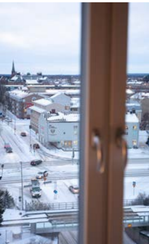
Från vardagsrummet blickar man bland annat ut över Navet och stadskyrkan.

– Det känns jättebra. Vi har börjat bo in oss och börjar till och med få upp grejer på väggarna, säger hon.