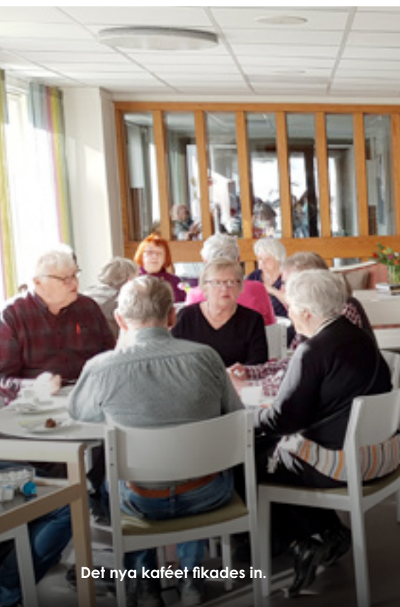
Det nya kaféet fikades in.

Aktivitetshusets möteslokaler finns tillgängliga för allmänheten, hör av dig med din förfrågan till fritid.boka@umea.se