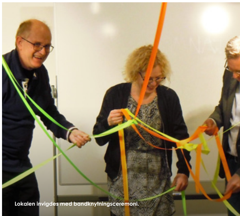
Lokalen invigdes med bandknytningsceremoni.