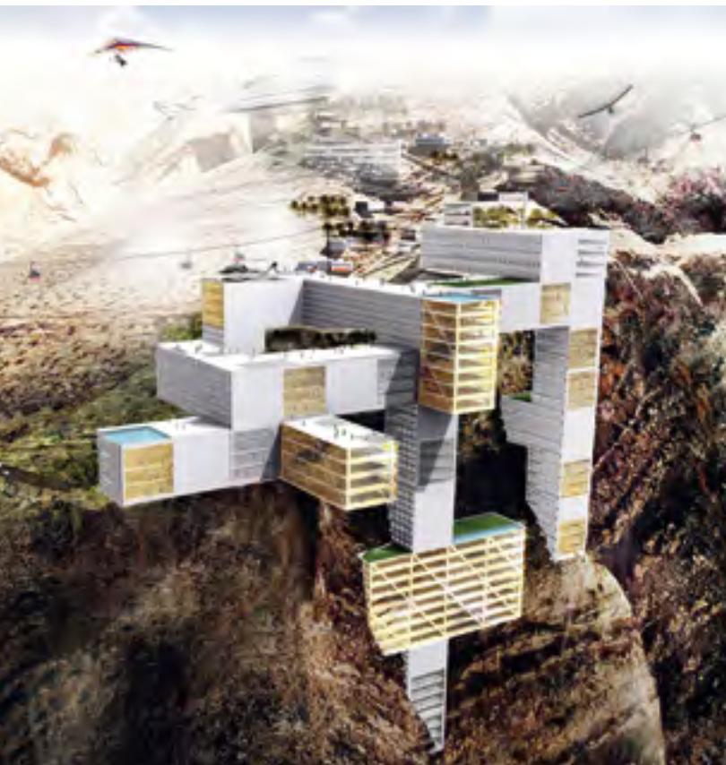
Illustrationer: Rem Koolhaas, OMA

En av nycklarna till Umeås framgång är mångfalden av kultur, kunskap och kreativitet. Här har Rem Koolhaas på OMA, The Office for Metropolitan Architecture, ritat hur han tänker sig turistorten Jebel al Jais i Förenade Arabemiraten med vindturbiner och solceller på huskropparna.