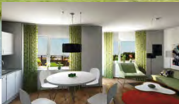
Bostaden har satsat på god kvalitet vid val av material i lägenheterna, med bland annat ekparkett i sov- och vardagsrum.

– Så småningom får vi väl se om vi blir aktuella för någon bostad här. Mycket talar för att vi i så fall flyttar hit.