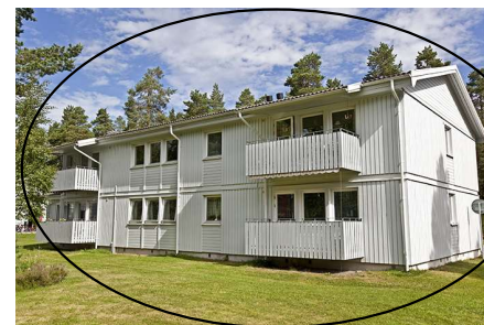
Hus 004, 6 lgh