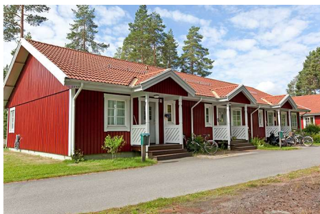
Hus 006, 3 lgh