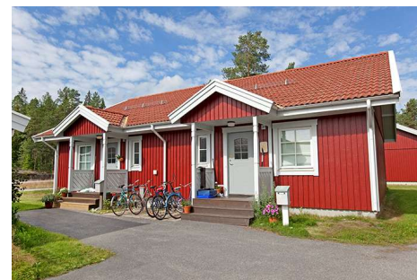
Hus 007, 2 lgh