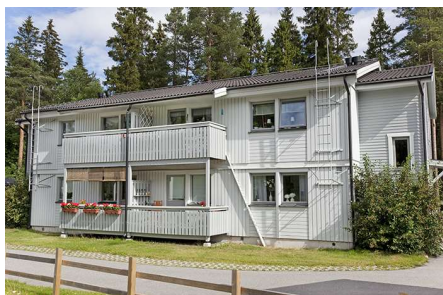
Hus 001, 4 lgh