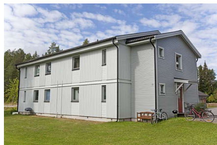
Hus 003, 4 lgh