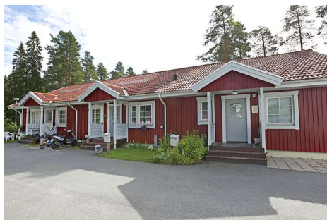
Hus 005, 3 lgh