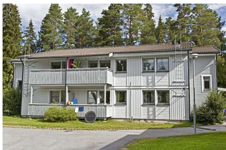
Hus 002, 4 lgh