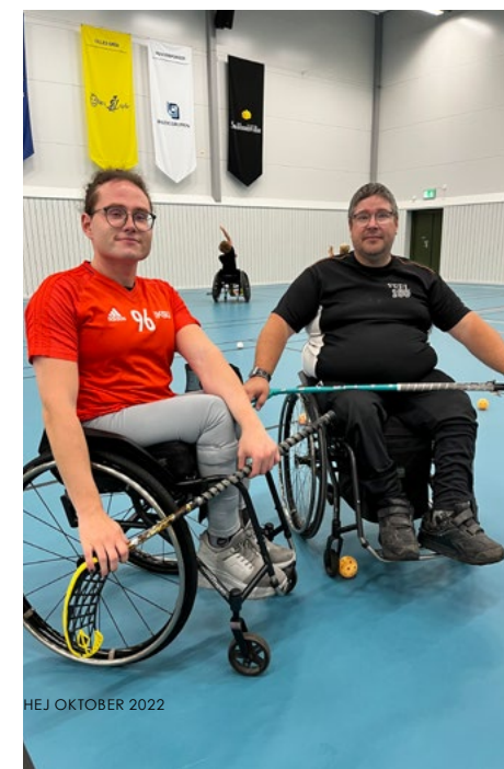
HEJ OKTOBER 2022