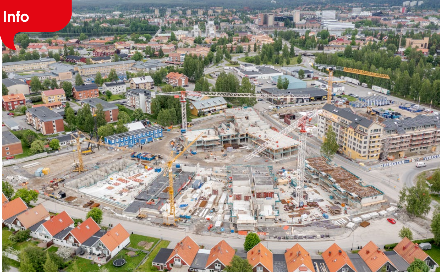
Drönarfoto över Bostadens område på Västteg, september 2022.