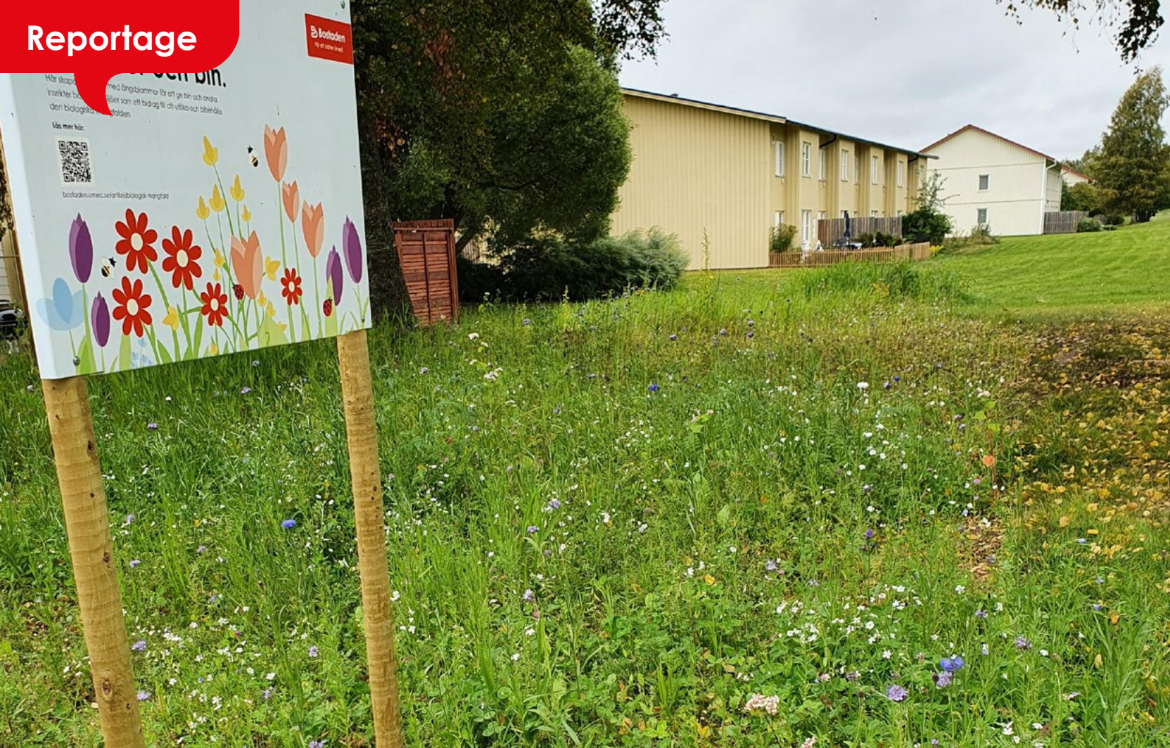
Text: Nils Fredriksson