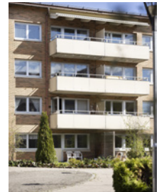
Huset på Magasinsgatan.

”Jag är en stadsmänniska. Helt klart. Och det är lätt att vara det i Umeå.”