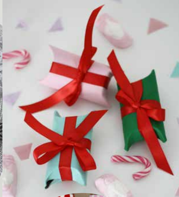
Tre pyssel du kan göra med toapappersrullar som grundmaterial: Julgransdjur, vackra snöflingor och tjustiga paket.